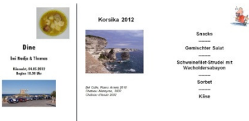
Bericht im Newsletter 3/2012