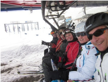
Bericht im Newsletter 1/2012