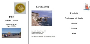
Bericht im Newsletter 3/2012