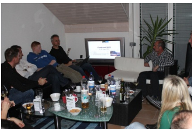
Bericht im Newsletter 2/2012