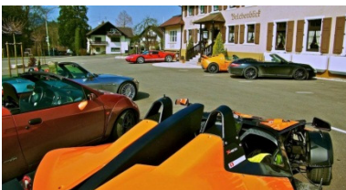
Bericht im Newsletter 2/2012