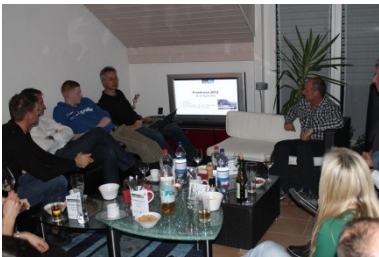
Bericht im Newsletter 2/2012