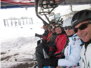
Bericht im Newsletter 1/2012